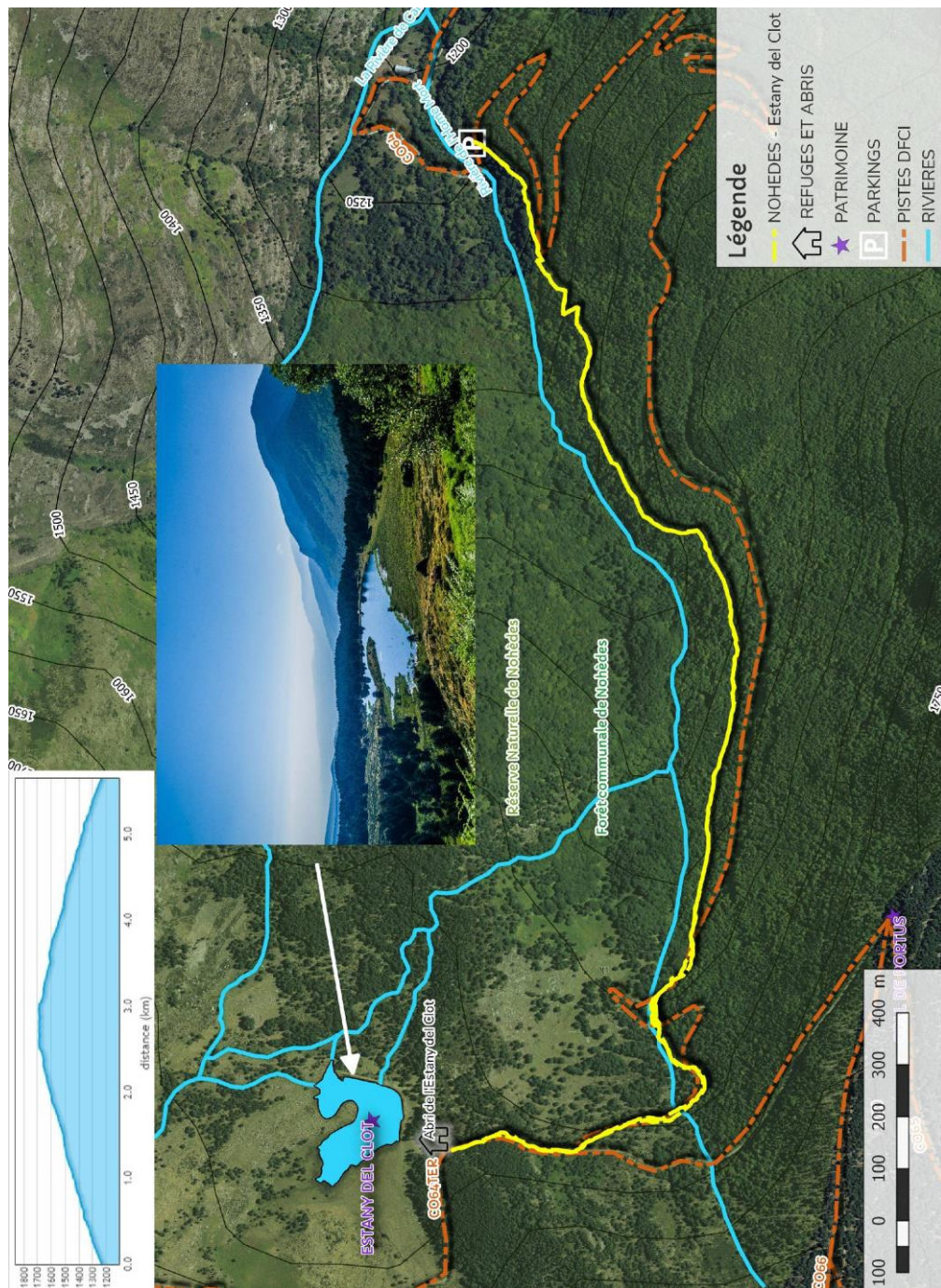
Carte IGN 1/25 2249 ET

Départ : Parking de Montellà - altitude 1240 m –