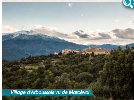
Village d'Arboussols vu de Marcèvol

Arboussols, village très agréable, entouré d'innombrables et ancestrales terrasses de culture. Sa situation privilégiée entre la méditerranée et la haute montagne lui donne un attrait tout particulier et la vue panoramique qui l'entoure ne laisse jamais personne indifférent.