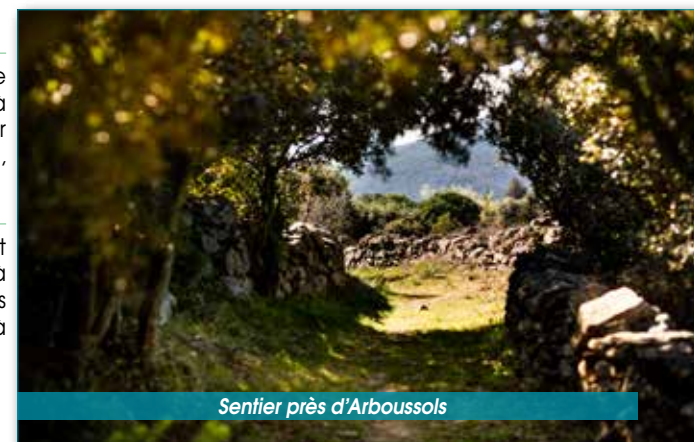
Sentier près d'Arboussols

6 Tournez sur votre gauche et continuez sur 750 mètres jusqu'à l'intersection laissée à l'aller, puis retraversez le pont pour revenir à votre point de départ.