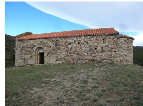
XIème siècle - Style Roman catalan

« Chapelle Ste Eulalie (Capella de Santa Euralia) ».