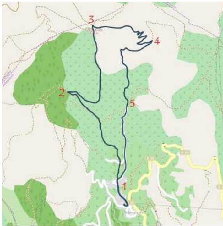
Carte IGN 1/25eme 2348 ET